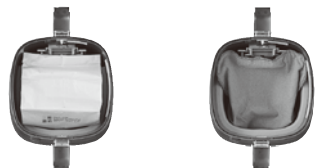
紙パック装着時 布バッグ装着時 (RD-ECOⅡRはオプション)

毎回取り替える衛生的な紙パックと何度でも繰り返し使えて経済的な布バッグをお選びいただけます。